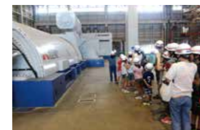
臨海コンビナート親子見学会