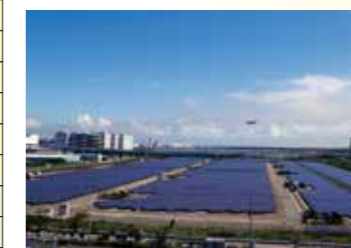
浮島太陽光発電所