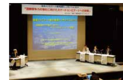
臨海コンビナート都市連携シンポジウム