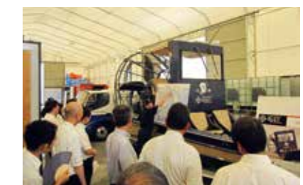
首都圏臨海防災センター視察